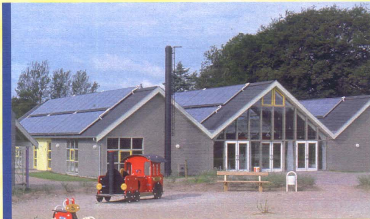
Solvarmeanlæg på ferie- og udflugtscentret Sankt Helene i Tisvildeleje. Arcon Solvarme, Rådg. Dines Jørgensen & Co A/S.

Deltag sammen med andre professionelle danske købere af solvarmeanlæg. Koordiner fælles indkøb og få indflydelse på prissætningen af solvarmeanlæggene.